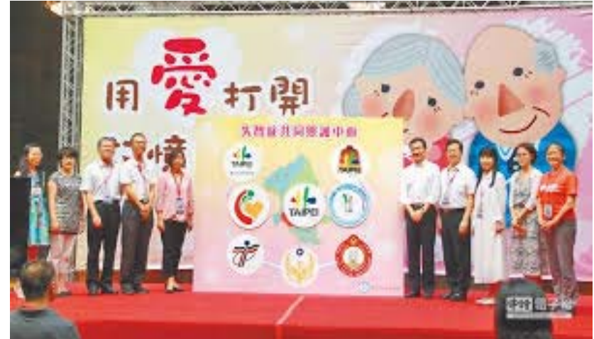
臺北市失智症照護網最早11個服務據點之一，也是唯一衛生財團法人承辦者