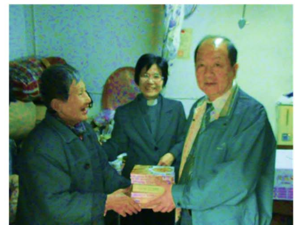
訪視基隆偏遠地區居家環境及致贈馬偕營養餐包關懷老人